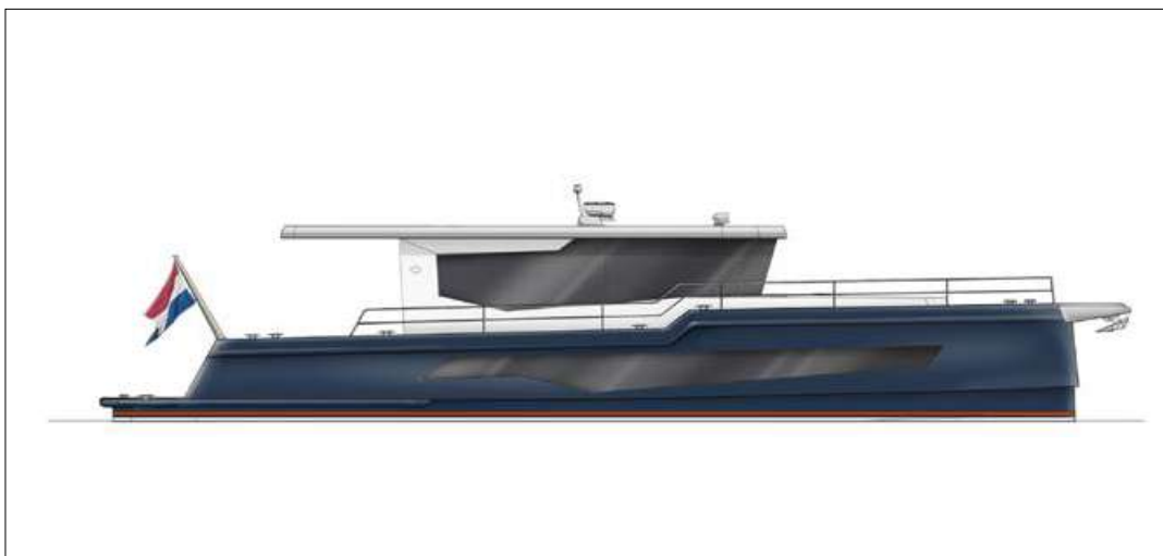
De Rover is solide gebouwd, ruim en klaar voor elk avontuur.